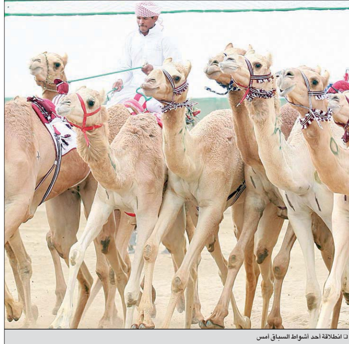
□ انطلاق أحد أشواط السباق أمس

وفاز بالشوط الثاني للجذاع قعدان «عجلان» ملك الشيخ عبد الرحمن بن جاسم آل ثاني، وجاء في